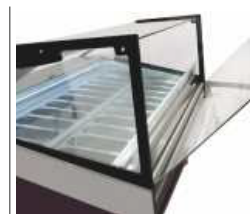
Cristal abatible Tilt forward glass