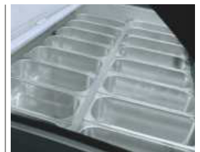
Combinación de bandejas Combination of trays