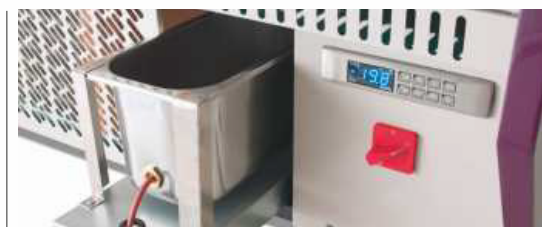
Bandeja evaporativa extraíble Removable evaporation tray